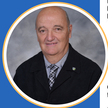
Rolland Camiré Maire