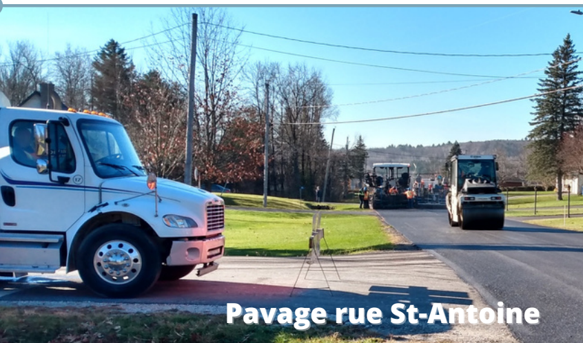
Pavage rue St-Antoine